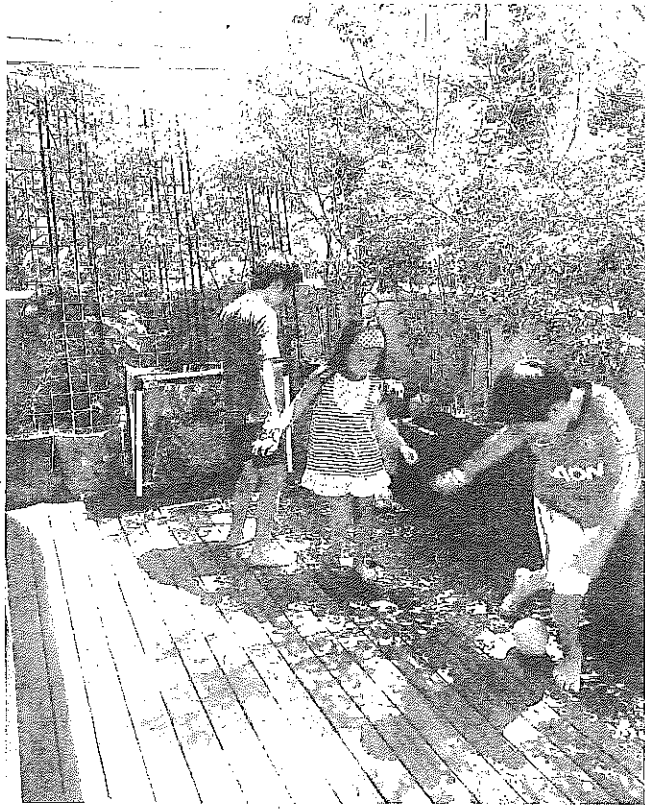
東京都江東区で撮影。ウッドデッキを敷いたベランダで遊ぶ子どもたち。多くの時間をここで過ごすようになったという(東京都江東区)。

解を得てください」と話す。ウッドデッキの見本材を用意しておくと説明しやすい。ウッドデッキの敷き方にも配慮が必要だ。細田木材工業の担当者は、「避難用はしごは覆わないようにする。また、排水溝の部分は、掃除がしやすいよう、ウッドデッキを簡単に取り外せるようにしている」と話す。